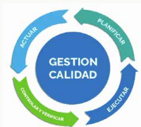
CUADRO 3: MODELO CIRCULAR DE GESTIÓN DE LA CALIDAD

Estas normas establecen todos los procedimientos que deben llevarse a cabo durante la actividad productiva de la empresa, definiendo la estructura organizativa, los procedimientos a realizar o los recursos a utilizar. El objetivo final es cumplir con las normas de calidad establecidas para garantizar que el resultado final será el mejor para nuestros clientes, al mismo tiempo que todos los procesos se simplifican durante la producción.